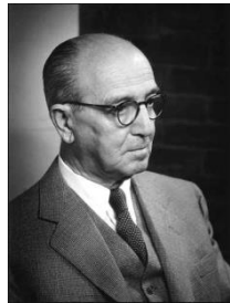
Hans KELSEN (1881-1973)