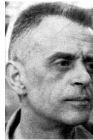
Maurice DUVERGER (1917-2014)