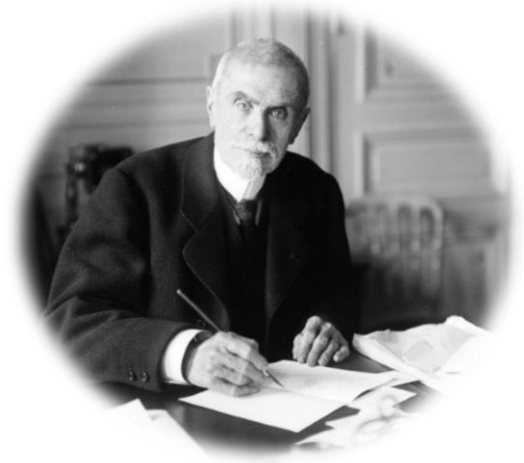
La personnalité du jour : Eugène PIERRE